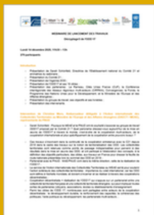
Compte-rendu du webinaire de lancement du groupe de travail