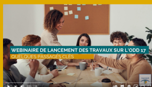
Vidéos des moments clés du webinaire de lancement du groupe de travail