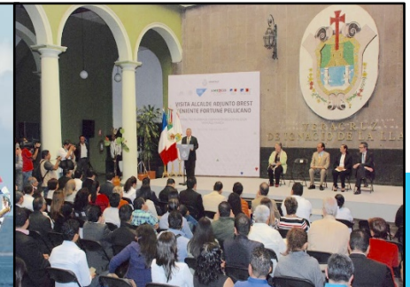
Présentation de Brest à l'Etat de Veracruz