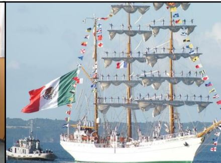
Le Cuauhtémoc lors des fêtes maritimes