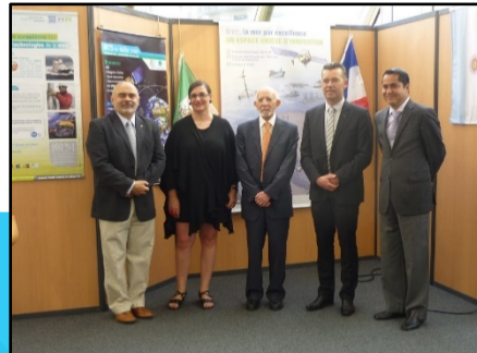
Safer Seas 2011 à Brest