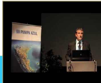
Conférence « Croissance bleue et coopérations outre-Atlantiques » à Brest en 2015