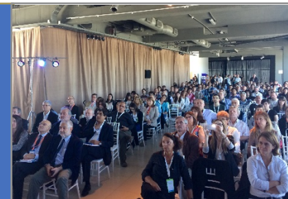
Symposium Bioéconomie en Patagonie en 2016