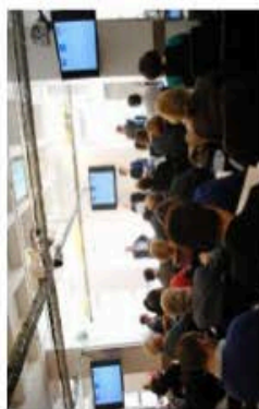
Table ronde JCD2015

Bordeaux Métropole et Châtelleraut ont abordé les partenariats concrets avec les acteurs du territoire, et les effets démultipliés sur le management interne de la collectivité, la prise de conscience de chacun et le rôle moteur de la collectivité pour fédérer et créer une approche horizontale dépassant les frontières de son propre territoire.