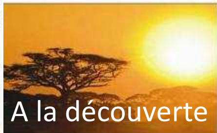
Coucher du soleil au Parc Fazao