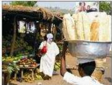
Scène de marché à Sotouboua