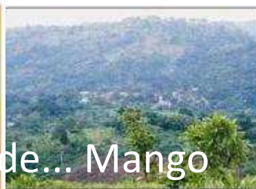
Coucher du soleil au Parc Fazao