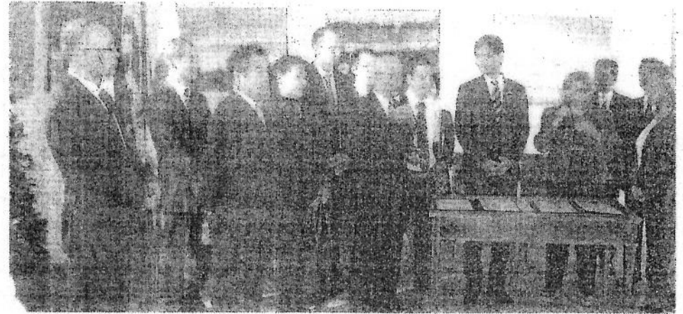
Partenariat conclu, prochain rendez-vous en 2013.