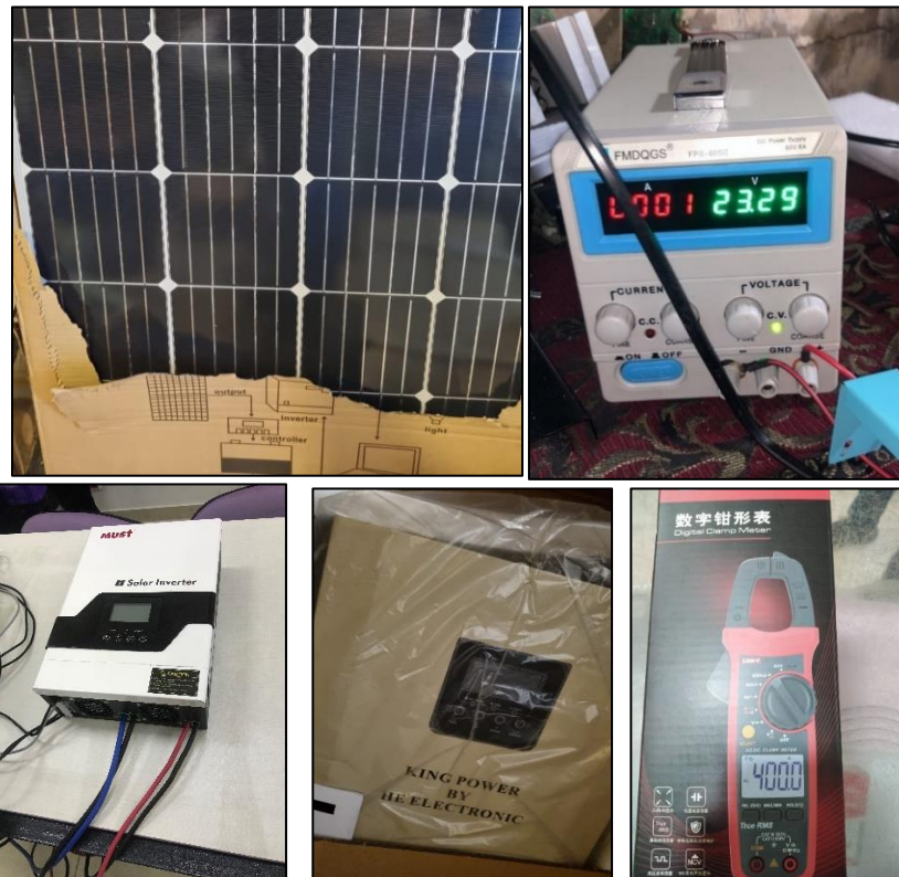
Equipements pour le centre de formation

-Fédération des municipalités d'Al-Qalaa : La formation mise en œuvre étant sur la photographie, la fédération d'Al-Qalaa a décidé d'utiliser le budget de cette ligne pour acheter une caméra qui sera mise à disposition des