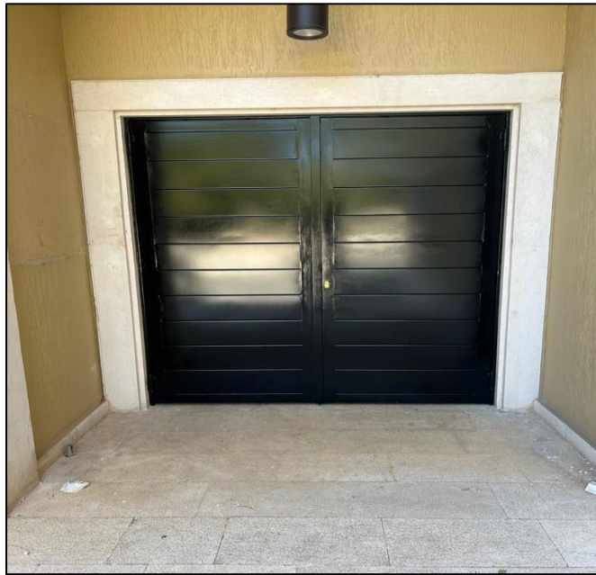
-Municipalité de Jdeideh-Harhraya-Qattine : Appui au centre de tri des déchets à travers l'installation d'une charpente métallique pour protéger la presse à balles.