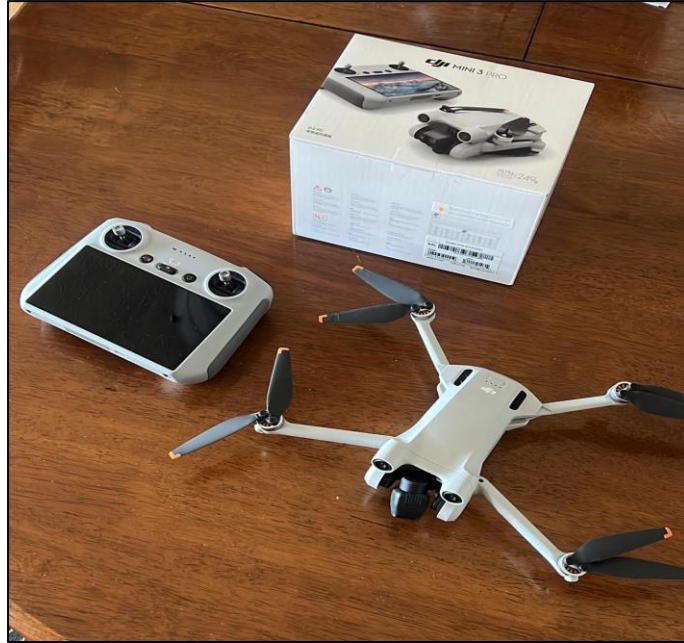
Caméra achetée par la fédération des municipalités d'Al-Qalaa

municipalités membres de la fédération. Le reste du budget a été utilisé comme indemnités pour les 21 personnes ayant suivi la formation (transport, frais divers, etc.). L'accord de CUF sur la proposition de la fédération d'Al-Qalaa a été communiqué le 10 janvier 2023.