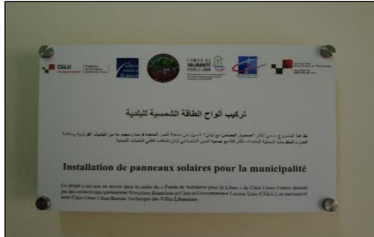
Plaque à la municipalité de Ghbaleh