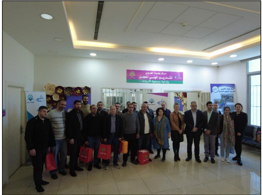
Les bénéficiaires avec les équipements- 28 mars 2023