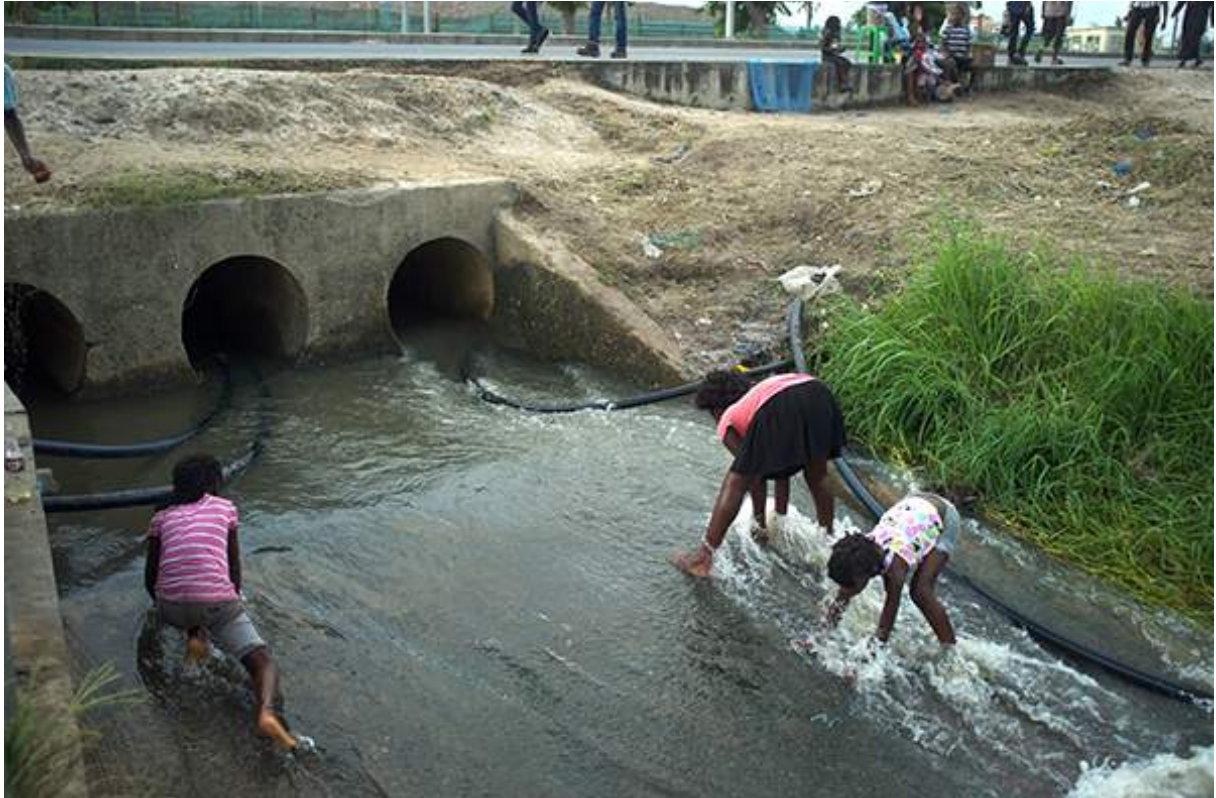
Figure 9 Banlieue de Beira