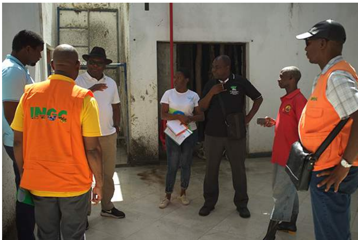
Figure 2 Théâtre de la Province