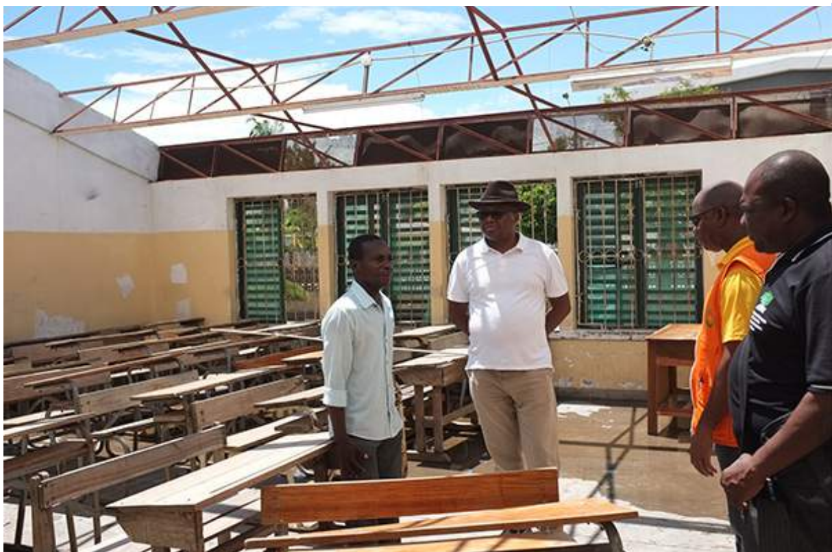
Figure 5 école