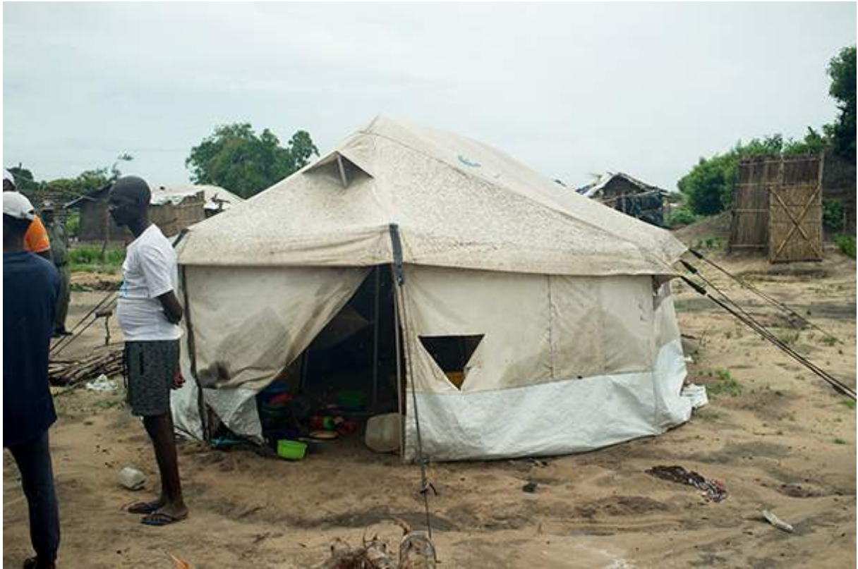
Figure 16 visite du camp des déplacés