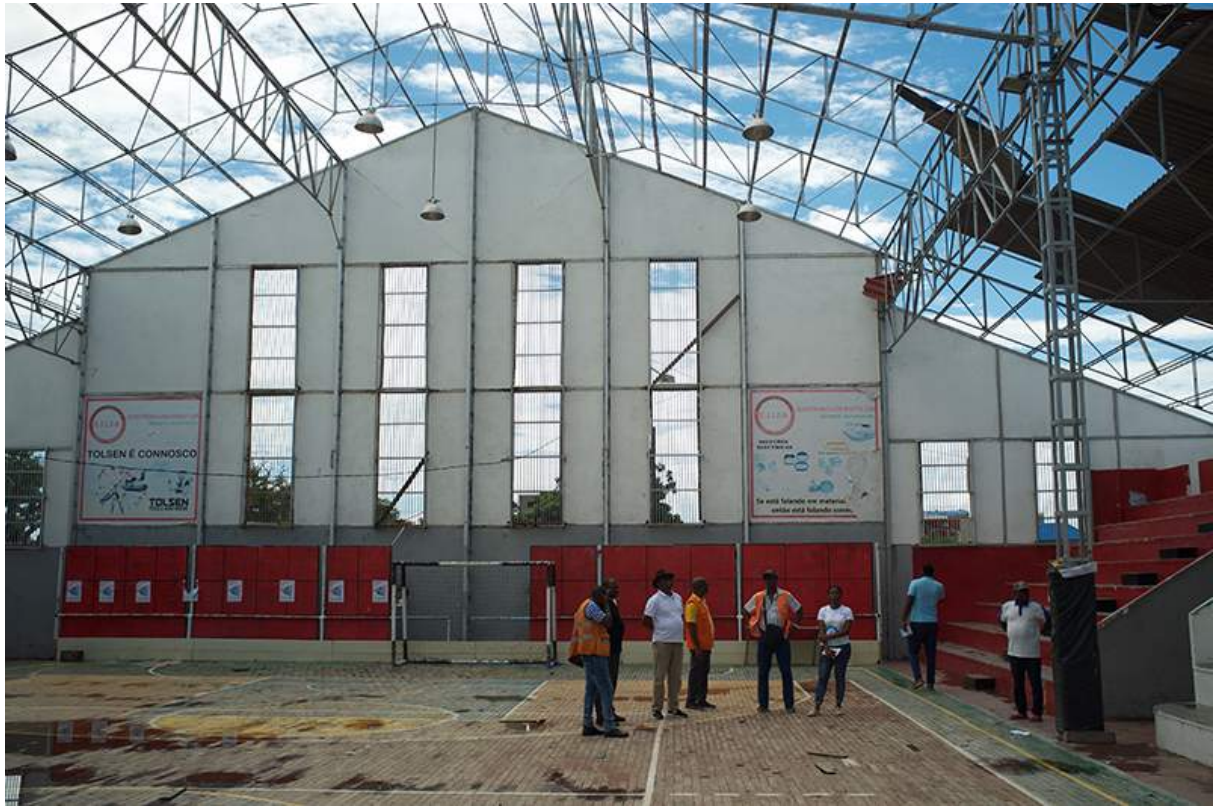
Figure 4 gymnase censé servir d'abris