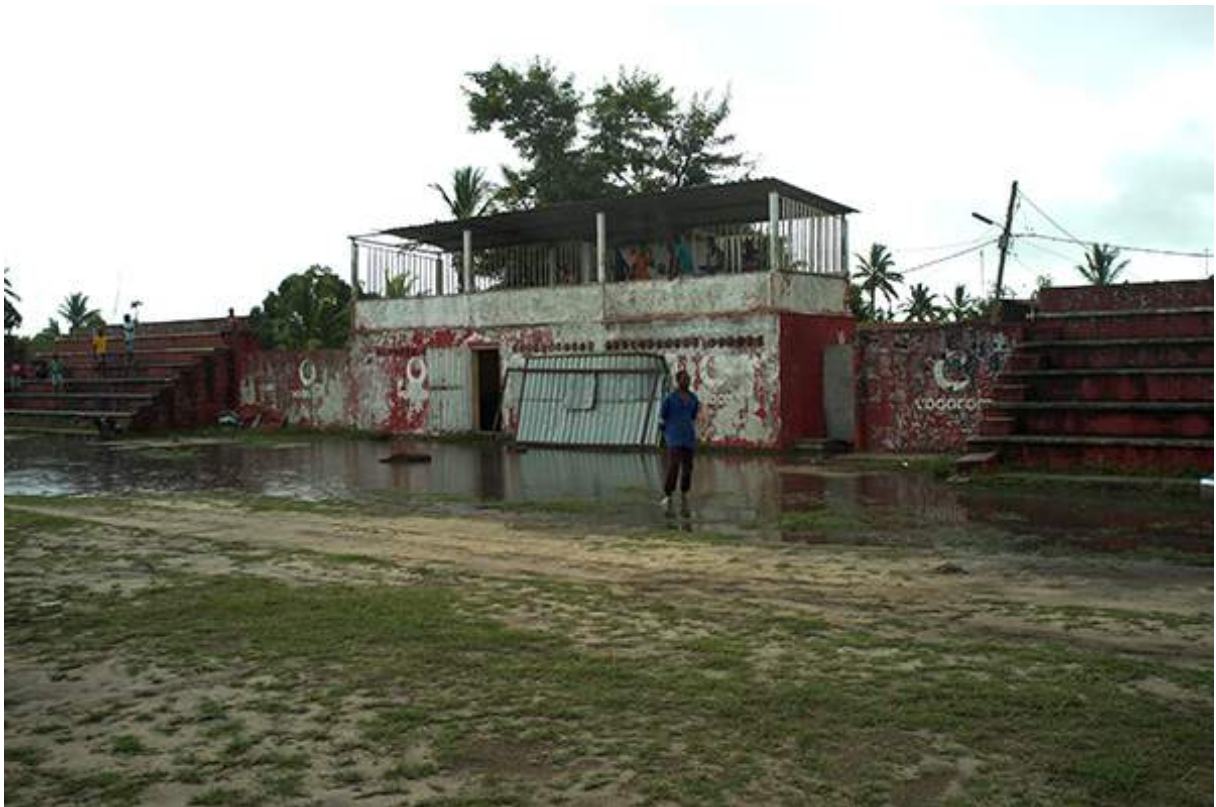
Figure 12 visite du stade