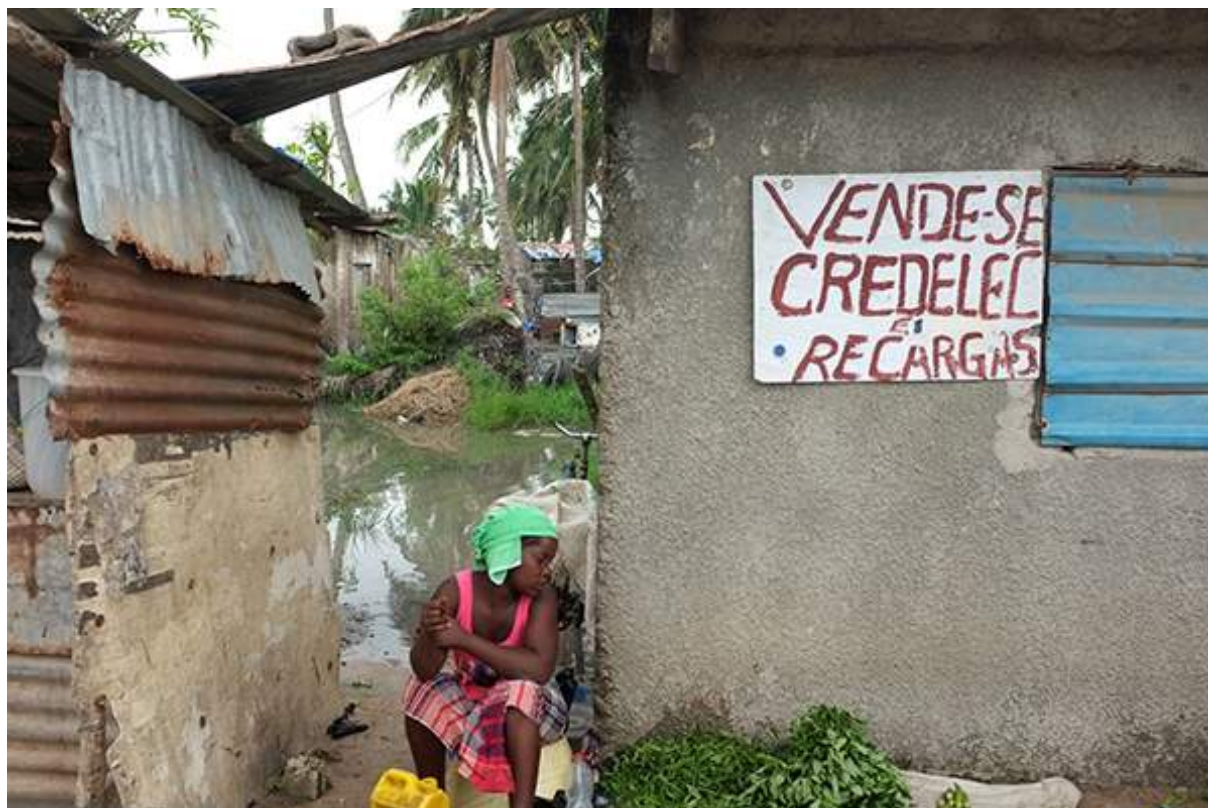
Figure 6 banlieue de Beira

Les besoins concernent l'eau, l'assainissement, mais aussi le traitement des déchets sont importants à Beira. Également les besoins en termes de formation des équipes municipales sont importants.