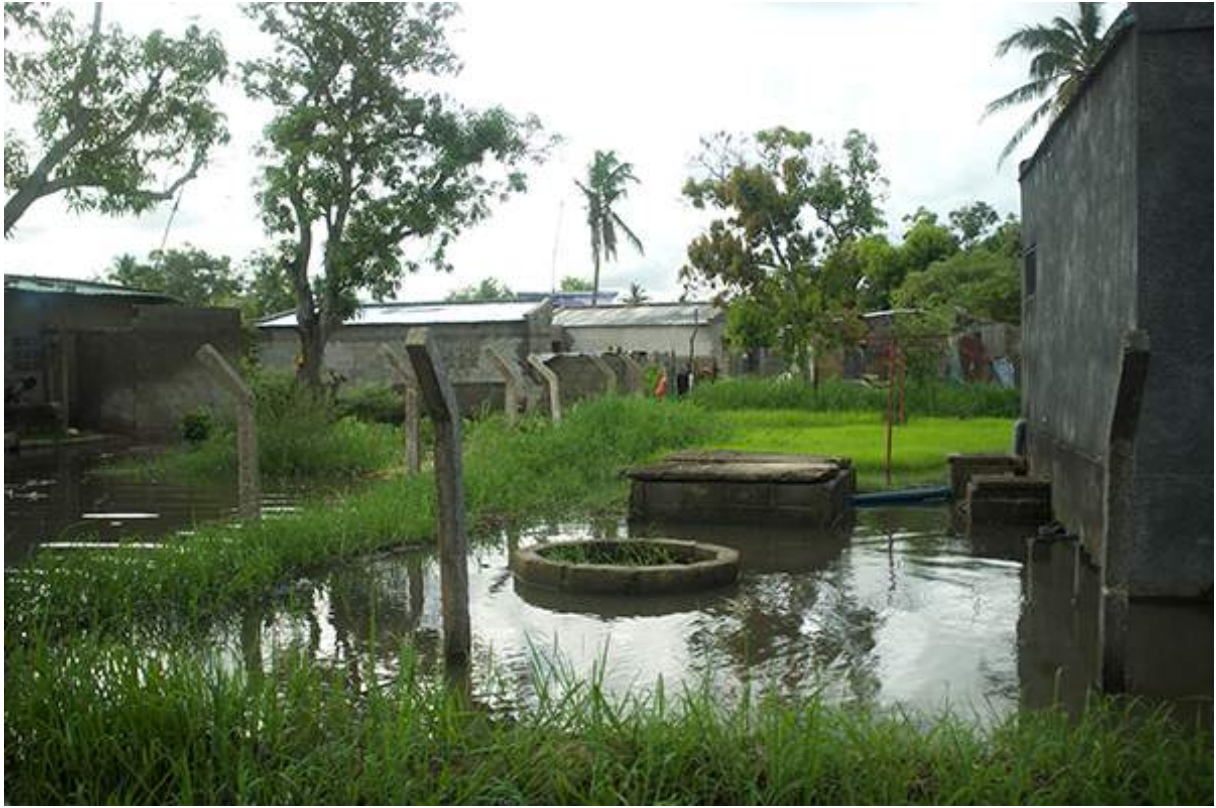
Figure 8 Banlieue de Beira