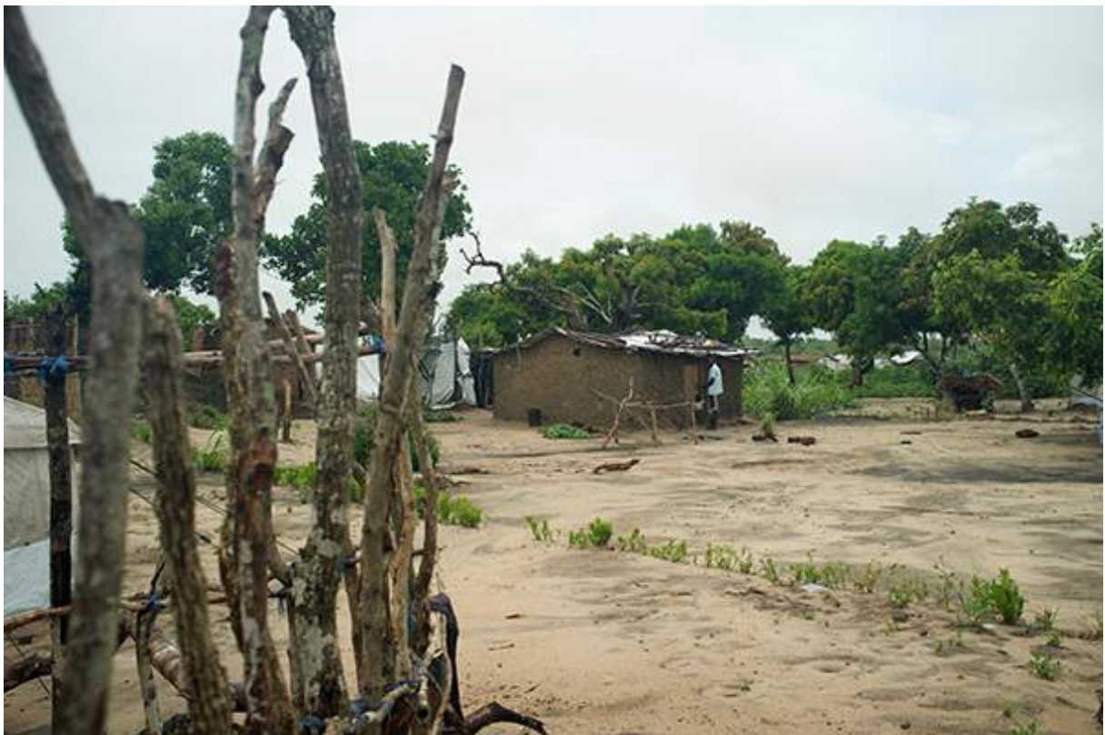
Figure 15 Visite du camp des déplacés