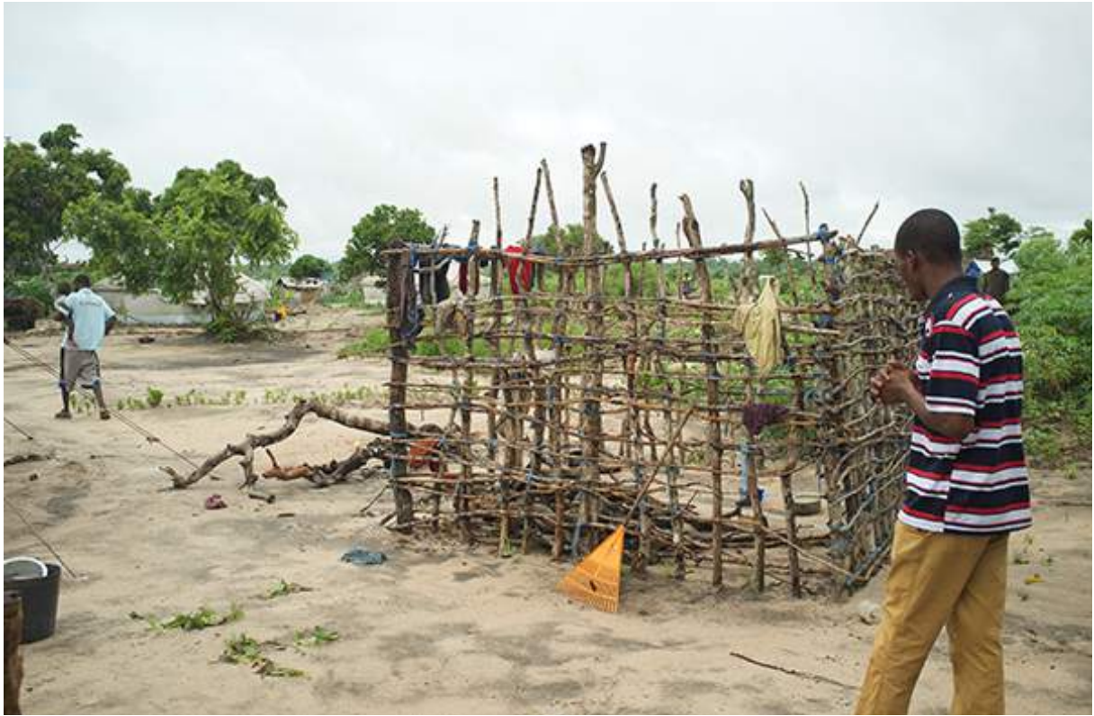
Figure 13 visite du camp de déplacés