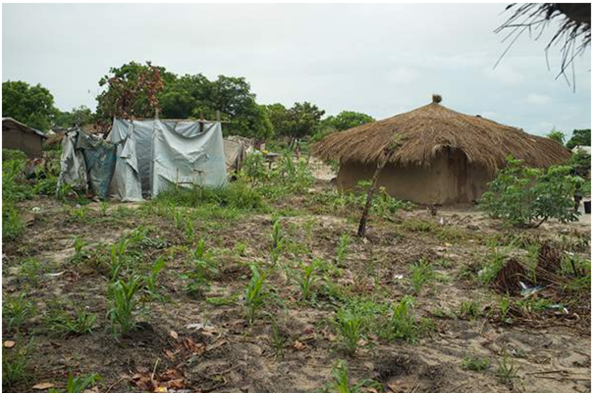
Figure 14 visite du camp de déplacés