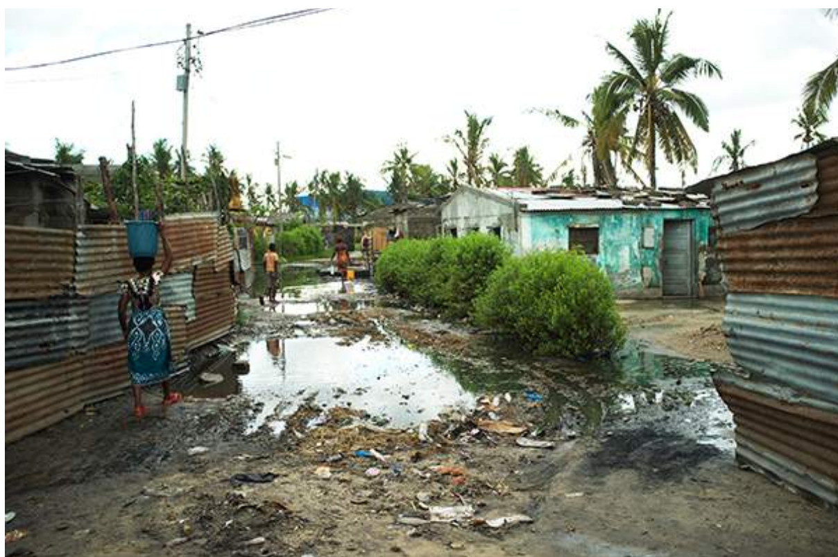
Figure 7 Banlieue de Beira