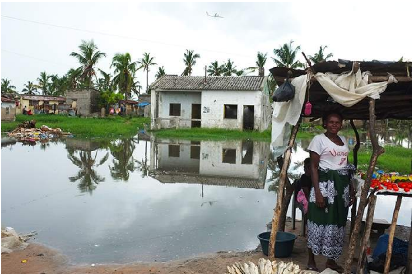
Figure 1 Banlieue de Beira