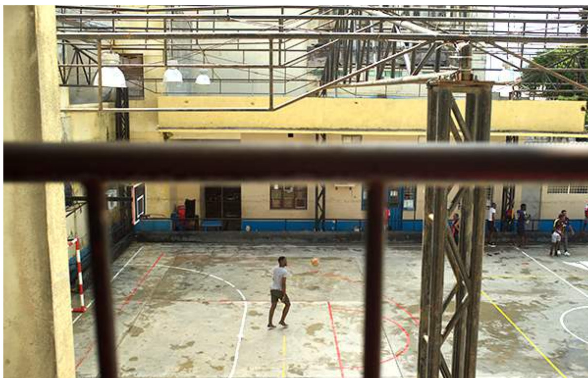
Figure 3 Ecole