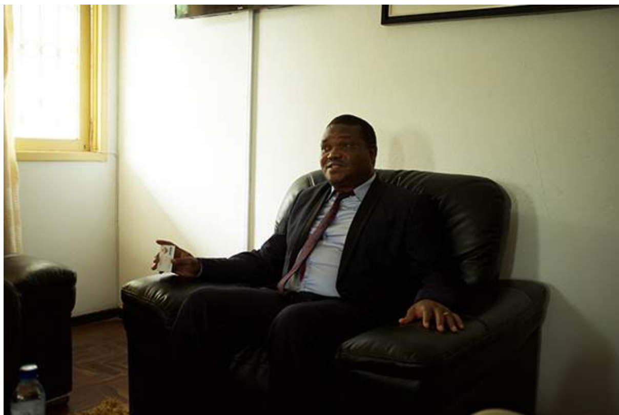
Figure 10 Maire de Dondo

La ville de Dondo a également préparé un « master plan » pour identifier les besoins de la ville dans le cadre de la reconstruction afin de faire de Dondo une ville plus résiliente.