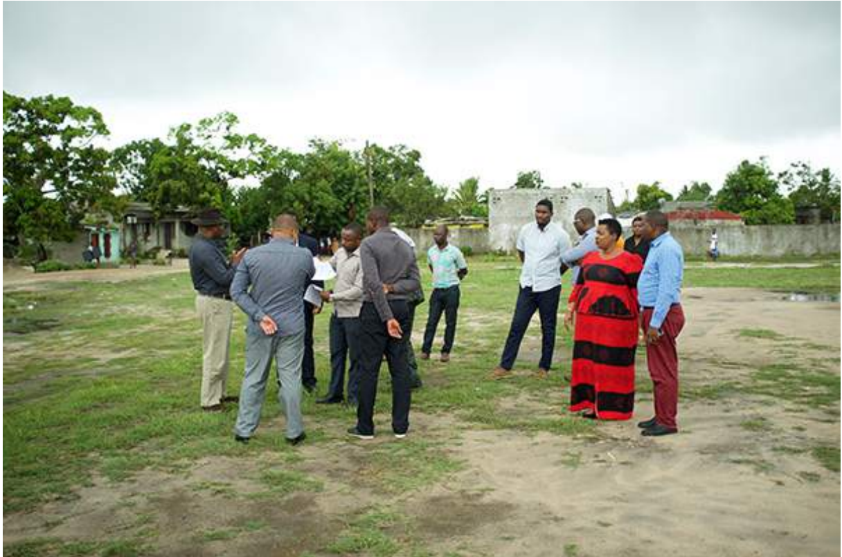
Figure 11 visite du stade