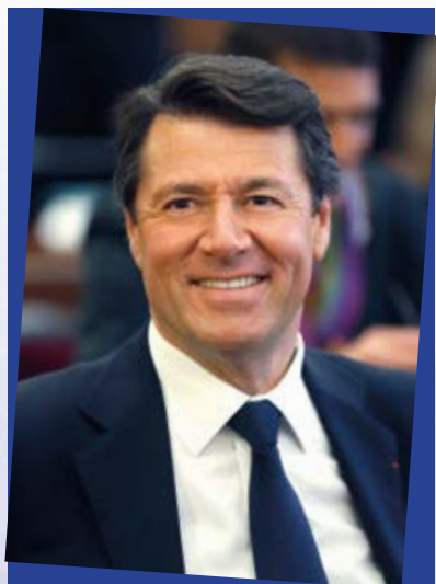
Кристиан ЭСТРОЗИ мэр Ниццы, президент метрополии, заместитель президента региона Прованс-Альпы-Лазурный берег

К ультура – это открытый взгляд на мир, сближающий людей, и кино является в нём одним из современных средств выражения – самых ярких, самых массовых, самых доступных.